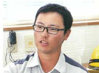
株木建設株式会社 茨城本店 小泉作業所 R2東関東小泉高架橋下部その3工事 現場代理人