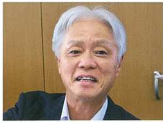
株木建設株式会社 ICT-現場支援室 室長

分を支援するイメージです」 まさにアナログからデジタルへの移行が迫られている時期ならではの留意点もあるという。 「ICTで格段に便利になる作業は多々ありますが、それが以前ほどのように行われていて、どこがどう便利になったのかを理解していないと、ただ楽な方法を知識として知っているだけになり、ボタン一つで何でもできると思ってしまう。そもそも目的や根本的な原理からわかっていなければ、いざという時に対応できなくなるので、そこは若い技術