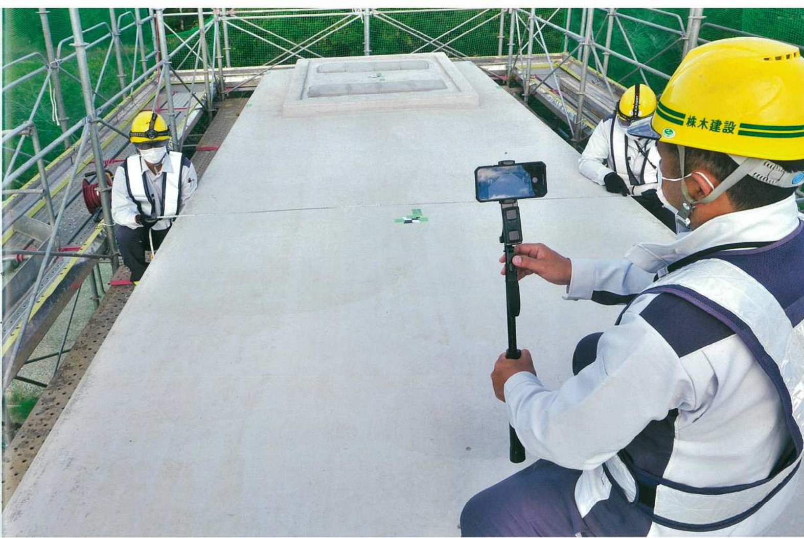
橋脚上での遠隔臨場の様子。スマートフォンを自撮り棒に装着し、足場など離れた場所からも撮影できるようにしている。