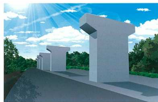
完成予想パース

「構造物の形状から、配筋、コンクリートの打設…。そういった工程がすべて再現できるので、手順も完成イメージも一目瞭然。新規で入場する技能者や外国人スタッフへの説明にも最適です」 二つ目は、三次元レーザーキャナリーの試行。完成した橋脚の周囲数カ所で三次元計測を行い、それ得られたモデル上のデータと実際の寸法を比較したところ、誤差は極小レベルであり、改めてその正確性を実感することとなった。 「通常は橋脚が出来上がったらずに埋め戻しなどの工程に追われて、出来形を確認する時間がなかなかとれないのですが、これによ