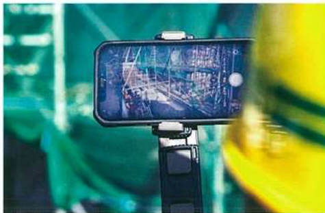
遠隔臨場で用いるスマートフォンの画面。「ウェアラブルカメラだと、装着してる本人にどこが映っているかわかりにくいので、この方法に落ちました」(海沢所長)

「やはり発注者」こと、現場ごとに事情が異なり、同じ発注者の中でも担当者によって温度差が生じる場合もあるので、すべての現場で一斉に取り入れるというわけにもいきません。導入自体初めてのケースも多く、デジタルへの抵抗感を抱く所長もいる。そこで我々のような支援室がフォローしようということですが」